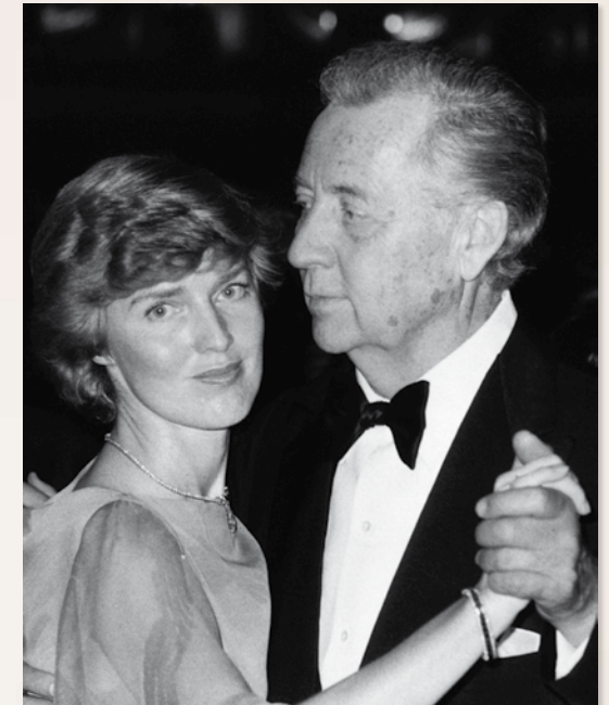
Friede und Axel Springer, Presseball 1982