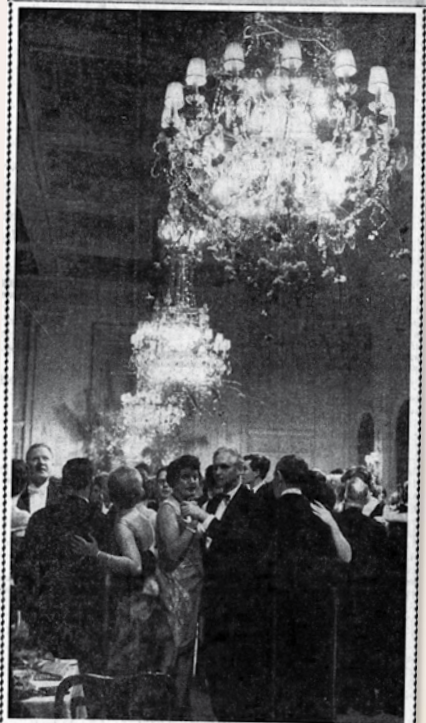
Mittelpunkt der rauschenden Presseball-Nacht: Der große Festsaal