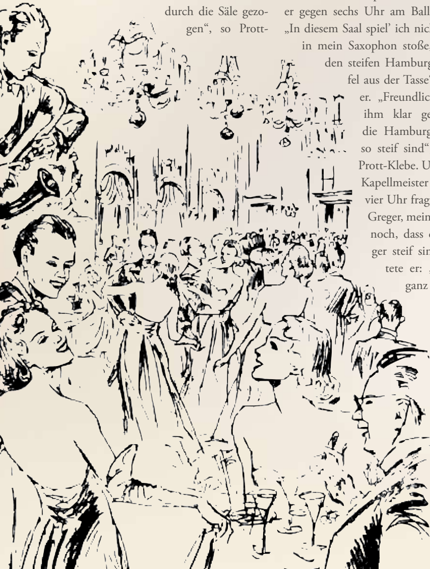
Rotationen im Dreiviertelakt, 1951