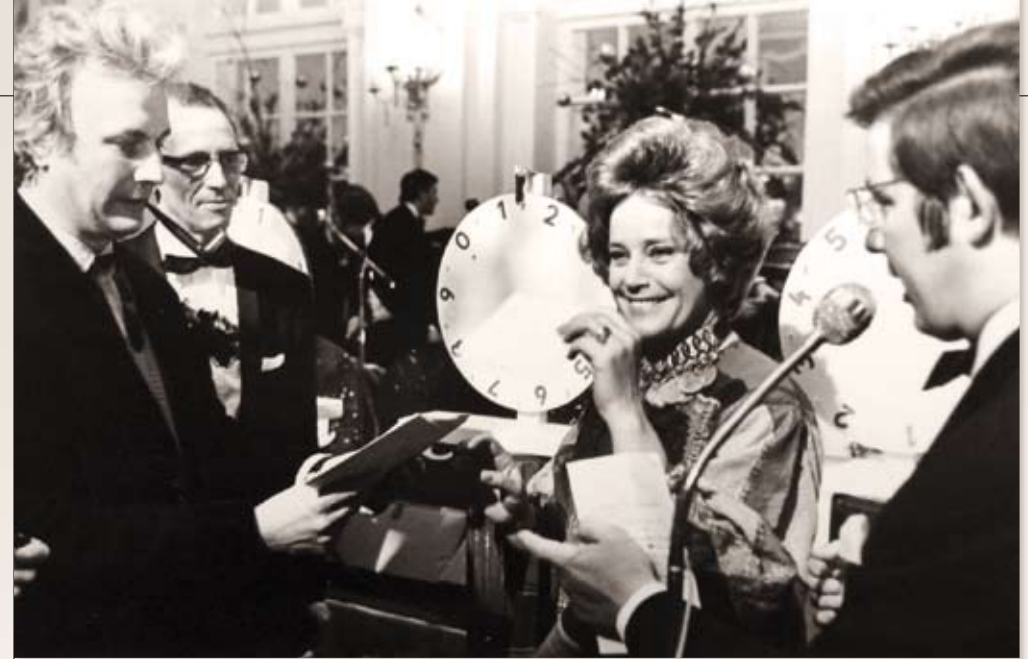
Maria Schell und die Tombola-Glücksräder, 1971