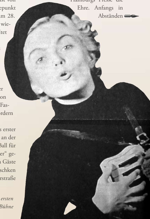
So stand Heidi Kabel, 1950 beim ersten Nachkriegs-Presseball, auf der Bühne

Seit der Jahrhundertwende also gibt sich Hamburgs Presse die Ehre. Anfangs in Abständen