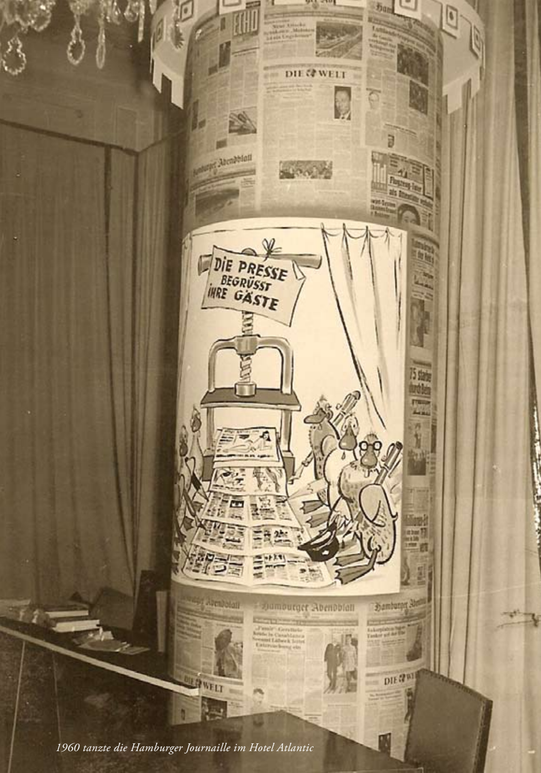
1960 tanzte die Hamburger Journaille im Hotel Atlantic